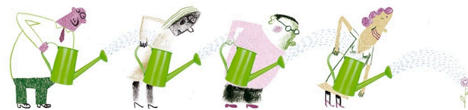
Imagem Klaas Verplancke

Esta pandemia nos alerta sobre nossa interdependência e nos convida a cultivar a solidariedade.