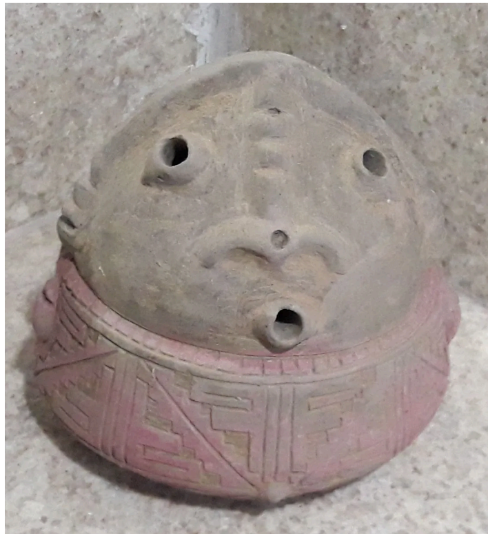
Imagem de escultura Carlos Amaral.

Por isso, lembramos que estamos sempre pensando em cada um, em cada uma de vocês.