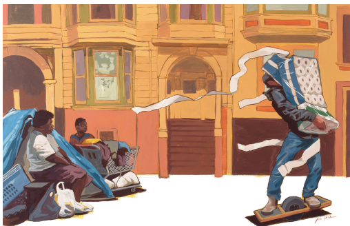
Imagem Jon Stich

A solidariedade não é inerente ao ser humano. É condição para existirmos, desde que nascemos. Somos capazes de projetar juntos/as um mundo com justiça e equidade.